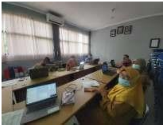
Gambar 3.3 : Rapat persiapan aplikasi JIBAS CBE untuk ujian sekolah.

Hasil wawancara dan observasi terkait pada pembelajaran daring di SMAN 1 Dramaga dapat dikatakan sebagai blended learning , karena pembelajaran daring lebih banyak menggunakan aplikasi tatap muka melalui zoom kemudian sinkronus nya menggunakan Google Classroom . Untuk Google Classroom menggunakan milik sekolah yaitu sman1dramaga.sch.id agar tugas siswa-siswa dalam pengelolaannya terpusat termasuk juga untuk Ujian Sekolah akan menggunakan aplikasi tertentu, aplikasi tersebut juga sudah digunakan di sekolah daerah lain akan tetapi untuk di daerah kabupaten Bogor baru SMAN 1 Dramaga saja yang sudah menggunakan. Nama aplikasi tersebut adalah JIBAS. Aplikasi tersebut diterapkan untuk meningkatkan kejujuran siswa, hal tersebut dapat terlihat jika siswa dalam mengerjakan ujiannya keluar dari halaman ujian maka secara otomatis akan selesai atau finish . Pernyataan tersebut diperkuat oleh dokumentasi dari rapat persiapan aplikasi JIBAS CBE untuk ujian sekolah, sebagai berikut: