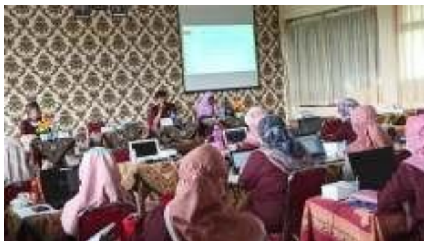
Gambar 4.1 :

Hal tersebut diatas diperkuat dengan dokumentasi ketika tim IT (SMANIDA IT) sedang melaksanakan rapat dengan memberikan arahan kepada guru-guru terkait perangkat pembelajaran yang akan digunakan, sebagai berikut: