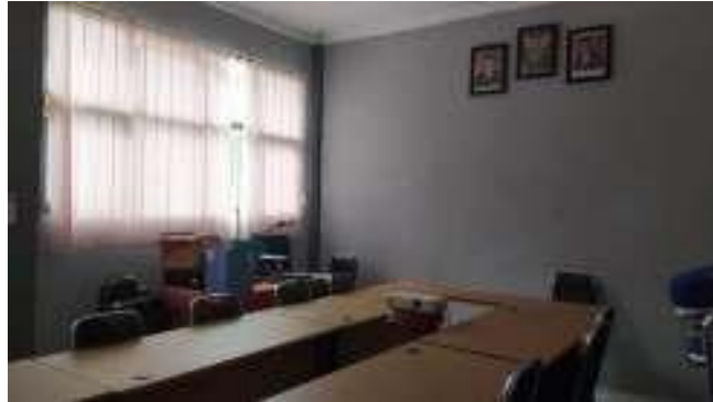
Gambar 3.2 : Ruangan Khusus Untuk Pembuatan Video Pembelajaran

Pembelajaran daring itu sendiri membutuhkan fasilitas sarana dan prasarana yang memadai dari segi perangkat teknologi untuk menghadapi siswa-siswamilenial. Penggunaan teknologi dalam pembelajaran daring perlu diketahui oleh guru itu sendiri, karena guru sebagai pelaku utama kegiatan belajar mengajar selain siswa. Dari hasil wawancara dan observasi peneliti ke SMAN 1 Dramaga, kepala sekolah melakukan perannya sebagai pemimpin dengan memberikan bantuan kepada guru-guru yang belum memahami penggunaan teknologi sebagai penunjang pembelajaran saat pandemi ini untuk bisa belajar IT dengan tim IT yang sudah dibentuk oleh kepala sekolah SMAN 1 Dramaga yang diberi nama SMANIDA IT.