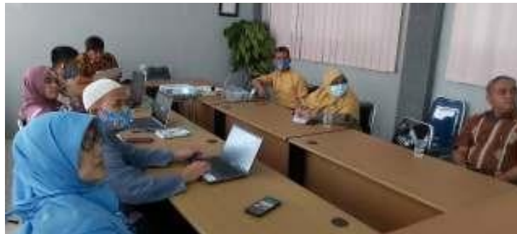
Gambar 3.1 : Rapat dengan tim manajerial sekolah.

Hasil penelitian tersebut diperkuat dengan dokumentasi sebagai berikut, yang dimana foto ini merupakan salah satu kegiatan rapat dengan tim manajerial sekolah :